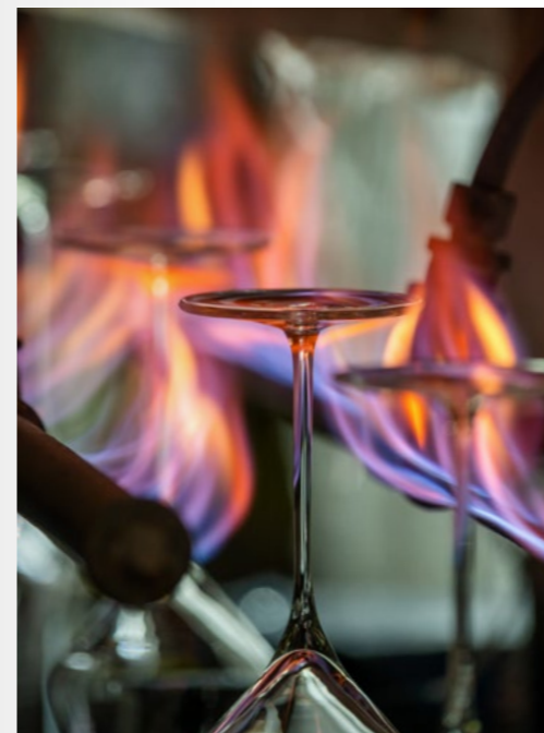
From the idea to production Von der Idee bis zur Herstellung