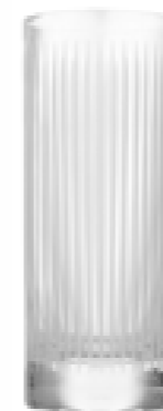
Longdrink 405 ml 165 mm Ø 66 mm