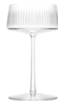
Champagne Saucer Grand Cru 316ml 174mm Ø 100m